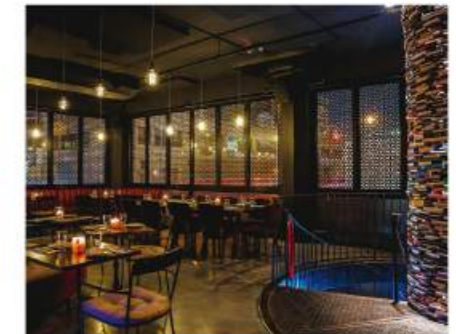
The exciting and fancy interior of the restaurant. 豪華な内装で客を待つ

Address: The Paper Factory Hotel 37-06 36th St. Astoria, Long Island City, NY 11101 Phone: (718) 706-8636