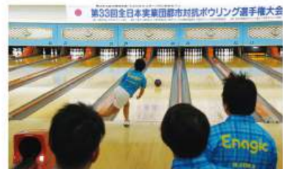
第33回全日本実業団都市対抗ボウリング選手権大会 The Enagic International team fought hard through all 49 games. 49ゲームを投げ抜いたエナジックインターナショナルのチーム

The 33rd All-Japan Corporate Inter-City Bowling Championship (sponsored by Japan Bowling Congress Incorporated Foundation) was held over 3 days, beginning February 5. Enagic International, which was representing Okinawa, admirably finished as a runner-up in this large-scale event, that had a whopping 76 teams from 50 different cities (4 players per team) competing against each other.