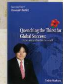
"Quenching Thirst for Global Success"