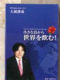
小さな島から世界を飲む!

「小さな島から世界を飲む!」エナジックの各支店または http://www.enagic.com で購入可