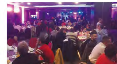
Hundreds of people gathered at the venue. 数百人が詰めかけた会場

ジネスを牽引し6A2-3に到達したポパさんのたゆまない努力を称え、さらに研修センターをフル活用して、いっそうの発展を遂げるよう熱い期待感を表明しました。数百人の参加者は、はるばる日本からやって来た大城会長夫妻を大歓迎し、セレモニーはたいへんな盛り上がりを見せました。