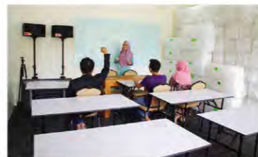
2nd seminar room. 第2セミナールーム