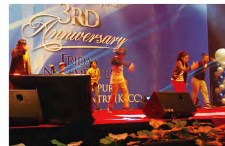
Lively dance performance by the children. 軽やかなステップで踊る子どもたち