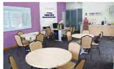
A lounge and reception counter (in the back) サロンと受付カウンター(奥)