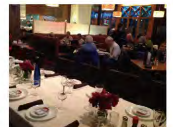
The restaurant is always bustling with a diversity of customers. 店内は多種多様な人たちがいつも賑わっている

米コロラド州の自然豊かな人口約4,000人の小さな町ベソルトにひときわ賑やかなアジアンレストランがある。それは「カンゲン アジアン クイジーン」という名の日本・ベトナム・タイ・中国・インドネシア料理が堪能できる店である。