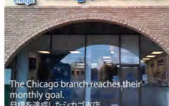
The Chicago branch reaches their monthly goal. 目標を達成したシカゴ支店