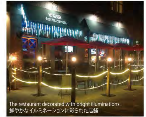
The restaurant decorated with bright illuminations. 鮮やかなイルミネーションに彩られた店舗