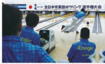
The team scored an average of 218.933 pins. アベレージ218.933を叩き出したチーム