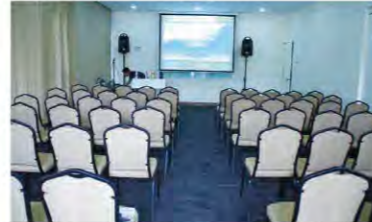
A seminar room with the capacity of 170 people. 最大170人収容可能なセミナールーム