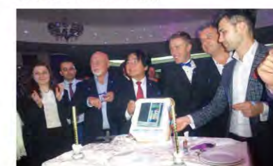
Leveluk shaped cake-cutting ceremony with the leading distributors. 有力販売店とともにレベルックをかたどったケーキに入刀