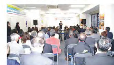
A fully packed venue. 超満員になった会場