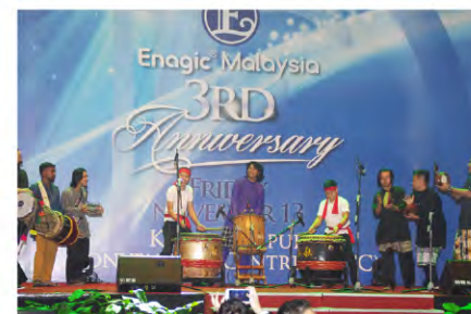
A grand percussion performance opened up the event. オープニングを飾った勇壮な打楽器演奏