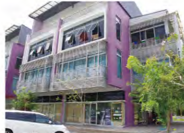
The office is located on the 1st floor of a new building. 新築ビル1階に入居するオフィス

Address: Lot 5-G-06, D'vida Business Park, Jalan Bazar U8/100, Bukit Jelutong, 40150 Sha Alam, Selangor