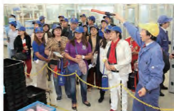
The Philippines team observing the parts production. 組立部門を見るフィリピンチーム

のメイドインジャパンを体感していました。先には香港チームやマレーシアチームが訪れるなど、海外からの大阪工場見学が相次いでいます。