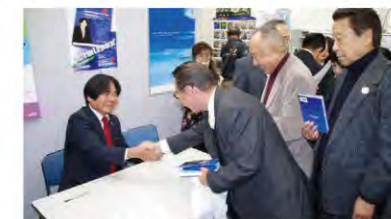
The long line at the signing desk. 行列ができたサイン会