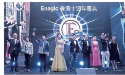
Asia's top leaders proposing the toast. 乾杯の音頭を取るアジアのトップリーダーたち