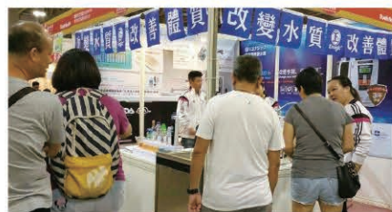
There was a steady stream of visitors at the Kangen booth. 「還元ブース」には常に人だかりが

各国から関連ブースが出ている中で、「還元水」をテーマにしたブースは高い人気を呼んでいました。