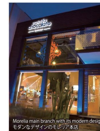
Morelia main branch with its modern design. モダンなデザインのモレリア本店

Address: Av. Ventura Puente 1641 Col. Electricistas 58290 Morelia, Michoacan Phone: +52 443 3146905 www.vainillachocolate.mx