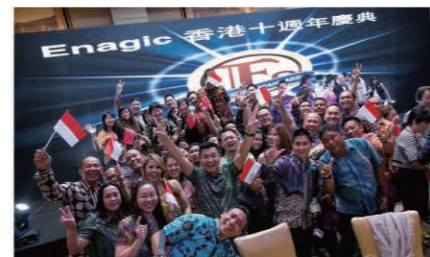
The vibrant Indonesia team. 元気いっぱいインドネシアチーム