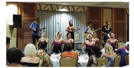
The ukulele and hula performance livened up the ceremony. 授賞式を盛り上げたウクレレ演奏とハワイアンフラ