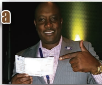
Proud smile with his title incentive cheque in hand. タイトルインセンティブの小切手を手にニコリ