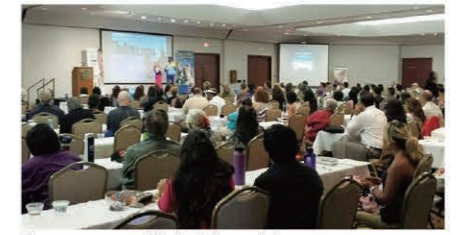
The venue was filled with participants. 会場のホテルは超満員に

トップリーダーたちによるトレーニングも白熱し参加者は熱心に学んでいました。また、2日目のディナーパーティのさいには、ハワイらしく、ウクレレ演奏に乗ったフラダンスで場を盛り上げてから各種ボーナスの授与式がおこなわれ、受賞者はたいへん喜んでいました。