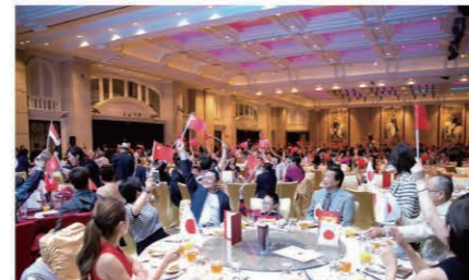
The largest group of the China team waving their flag. 国旗を振るう最大多数の中国チーム