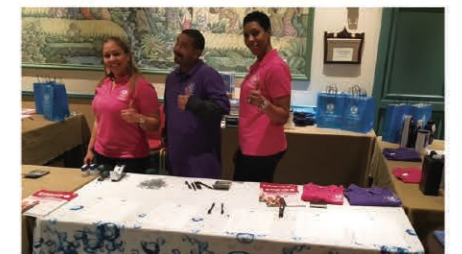
Related goods were also popular at the event. 関連グッズも人気の的