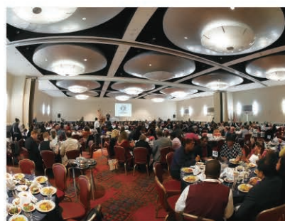
400 people celebrate the new branch office 400人が新支店開設を祝う

4階にあるオフィスを同じビルの1階に移しスペースも2倍以上に拡大します。実際の移転オープンは来年1月の予定ですが、より広くより使いやすくなった新オフィスへの期待感が高まっています。