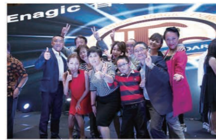
Team Japan also joined in on the celebration. 日本チームも10周年を祝う