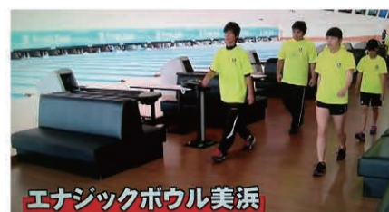
エナジックボウル美浜 Academy students on their way to practice. 練習に励むアカデミーの生徒たち