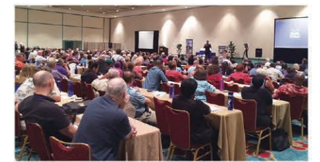
400 "students" attended the "university." 400人が「大学」で学んだ

このイベントは「Kangen大学」と名付けられ、上記トップ販売店の皆さんが「受講生」のニーズに合わせたセミナーやトレーニングをおこないました。2日間の「講義」を通じて、確かなコミュニケーションの方法や商材とプログラムの正しい知識を得るなど、多くの販売店にとって貴重な学びの場となったようです。