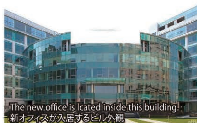
The new office is located inside this building! 新オフィスが入居するビル外観

LLC "Enagic Russia" Letnikovskaya Str. 10 bldg. 4, floor 1, 115114, Moscow, Russia Phone: +7 (495) 988-02-05; Fax: +7 (495) 988-02-06