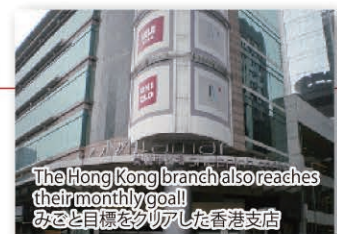
The Hong Kong branch also reaches their monthly goal! みごと目標をクリアした香港支店

Hawaii/ハワイ, New York/ニューヨーク, Vancouver/バンクーバー, Brazil/ブラジル, Hong Kong/香港, Indonesia/インドネシア, Philippines/フィリピン and Okinawa/沖縄