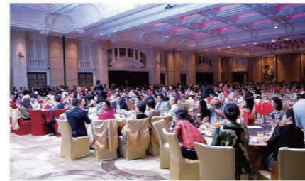
The venue overflowed with over 1,000 people. 1,000人以上が会場を埋め尽くす

さらにこの4月、香港初の6A2-5に到達したケネス・ウオンさんが中国本土出身の6A2-4販売店で妻のリアオ・チュン・ジュエンさんと共に舞台上で記念のトロフィーを受け取ると、満場の喝采を浴びていました。その後、10月までに6A(以上)に昇格した30人余の販売店の認定証授与式に移ると、会場の熱気は最高潮に達し、販売店一同はゆるぎない団結精神を発揮していました。改革開放の先陣を切った深圳市から、エナジック・ビジネスは中国本土に急速に浸透しつつあります。