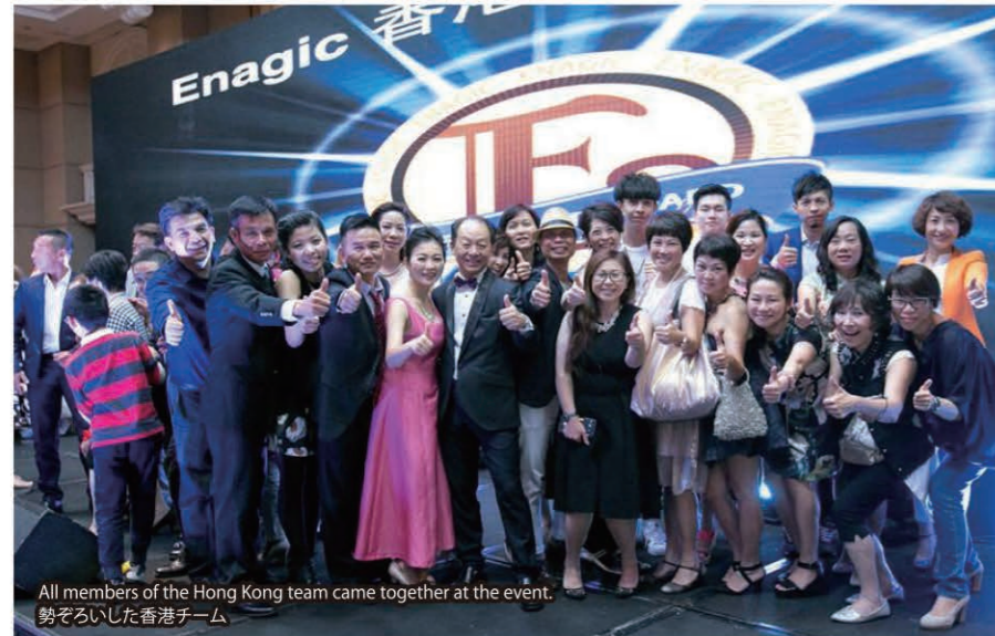
All members of the Hong Kong team came together at the event. 勢ぞろいした香港チーム

On October 10, Enagic Hong Kong's 10 year anniversary celebration was held in Shenzhen, Guangdong, which is situated next to Hong Kong and is one of the most successful Special Economic Zones. Over 1,000 distributors gathered at the hotel venue, many of which were from Hong Kong and China while others traveled from Japan and Southeast Asia.