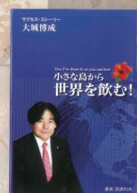
小さな島から世界を飲む!

「小さな島から世界を飲む!」エナジックの各支店または http://www.enagic.com で購入可