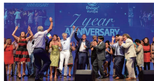
The big chorus of our Ireland distributors heightened the excitement. 大合唱で会場を盛り上げるアイルランドの販売店