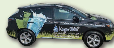
A daring Kangen Car design. 斬新なデザインのKangen車(カー)