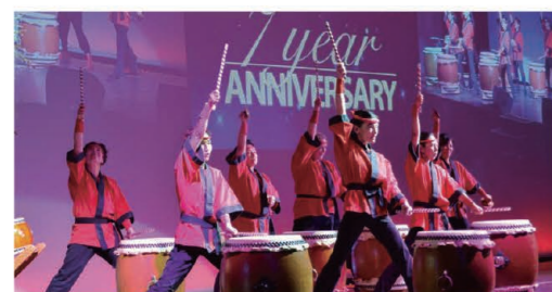
A powerful performance was given by the local Japanese drum team. 場内に響き渡った現地和太鼓チームの力強い演奏