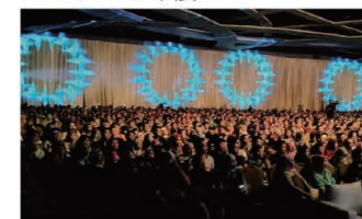
The venue overflowed with 2,000 participants. 2,000人で埋め尽くされた会場