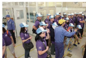
Everyone attentively observes the assembly of parts. 組み立て部門を熱心に見学