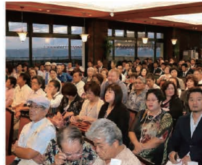
Around 200 people rushed to the launch party. 約200名が詰めかけた出版記念会