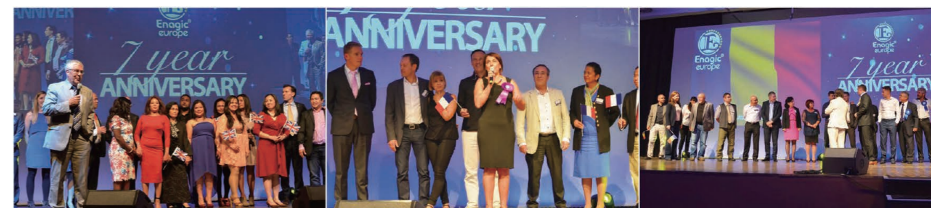
(From left) Distributors from England, France, Romania, were introduced on stage. 壇上で紹介される(左から)イギリス、フランス、ルーマニアの販売店