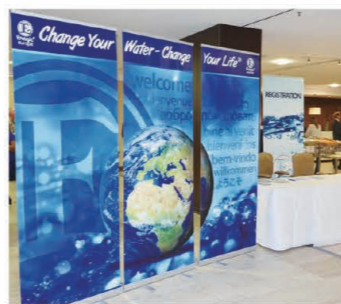
The impressive banner near the reception area 受付付近に設えた印象的なバナー