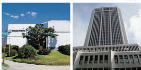
Enagic LA (left) & Enagic Singapore

このほど、シンガポール、ブラジル、東京、フィリピン、ロサンゼルス5支店が8月度の目標を達成しました。これも販売店の皆さんの熱心なご協力と支店長を初めとする支店スタッフの努力の賜物です。来月は果たしてどこが? 全支店のスタッフ一同、みな揃って張り切っています。