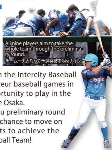
All nine players aim to take the whole team through the preliminary round. チーム一丸となって予選突破を狙うナイン

エナジック硬式野球部も9月5日開始の九州地区予選に参加し、まずホンダ熊本と対戦することになりました。この予選には15チームが参加し、うち2チームだけが本大会に出場できます。エナジック硬式野球部は念願の全国大会出場をめざし奮闘しています。みんなで応援しましょう!