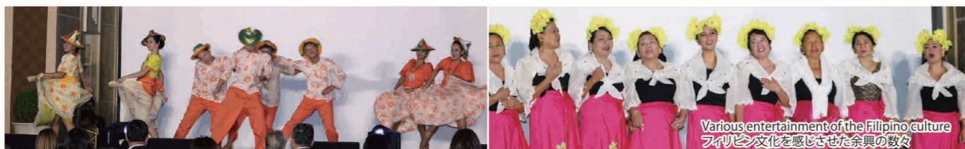
Various entertainment of the Filipino culture フィリピン文化を感じさせた余興の数々