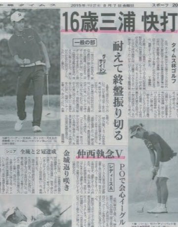
The astonishing performances of the golf academy students were covered in several newspapers. アカデミー所属選手の活躍を伝える各紙