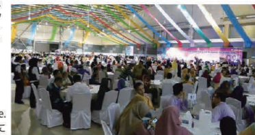
The venue overflowed with 1,500 people. 会場は1,500人で超満員に

イベントは、新6A(以上)の販売店が次々に壇上に呼ばれる認定証授与式になると最高潮をむかえました。その後は余興が繰り広げられ、参加者は楽しいひと時を過ごしました。11月13日のマレーシア支店開設3周年記念式典もさぞ盛大なイベントになることでしょう。(くわしくは5Pを参照)。