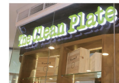
The green color theme gives the restaurant a natural feel. 自然素材をイメージさせるグリーンが店の基調

Address: UP Town Center, Katipunan Ave, Quezon City, Philippines Phone: +63 (2) 277-0622