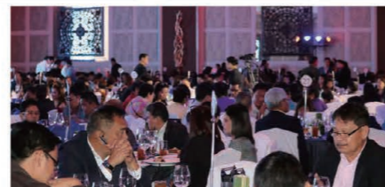
1,000 people gathered to celebrate the 5th year anniversary. 5周年を祝って1,000人が駆けつけた