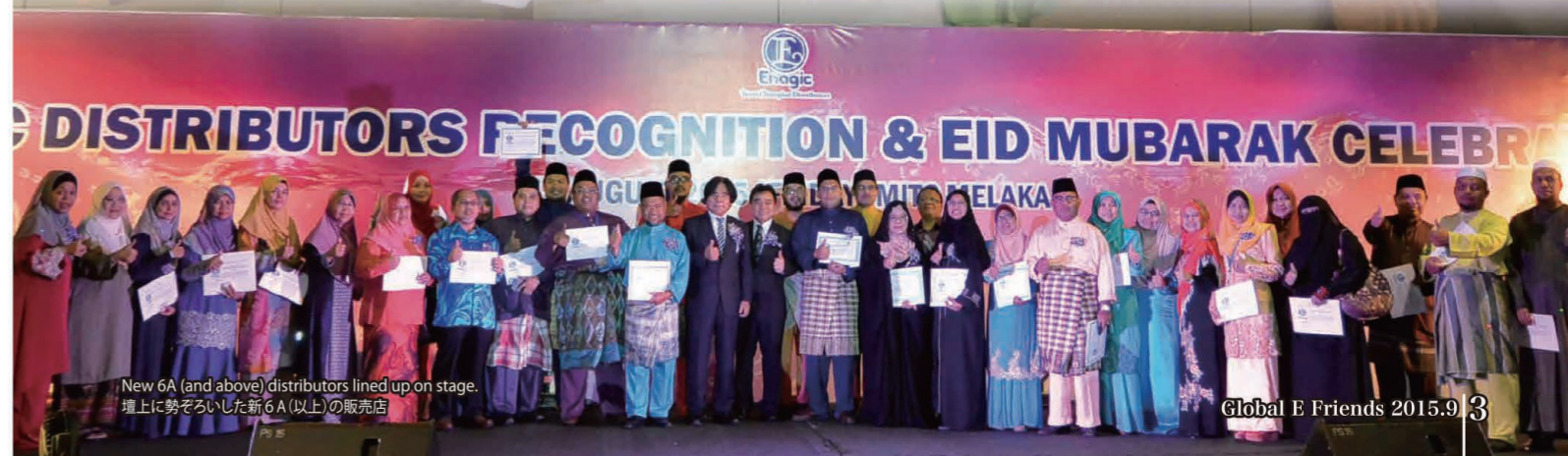
New 6A (and above) distributors lined up on stage. 壇上に勢ぞろいした新6A(以上)の販売店