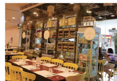
Spacious restaurant capable of accommodating around 70 people. 約70人がラクラク坐れるスペースを確保

The former capital of the Philippines, Quezon City, exists as the core city of Metro Manila. Located on the campus of the University of the Philippines in the center of Quezon City, is the large shopping mall, UP Town Center. It is there on the 2nd floor, where you will find "The Clean Plate," an organic Filipino, Spanish and Italian restaurant. The soft natural light from the glass windows brighten up the restaurant, where the walls and ceiling are decorated with a variety of greenery. The tables and chairs are made of wood, which add to the organic feel of the restaurant.