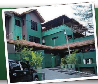
The training center opened in July. 7月にオープンしたトレーニングセンター