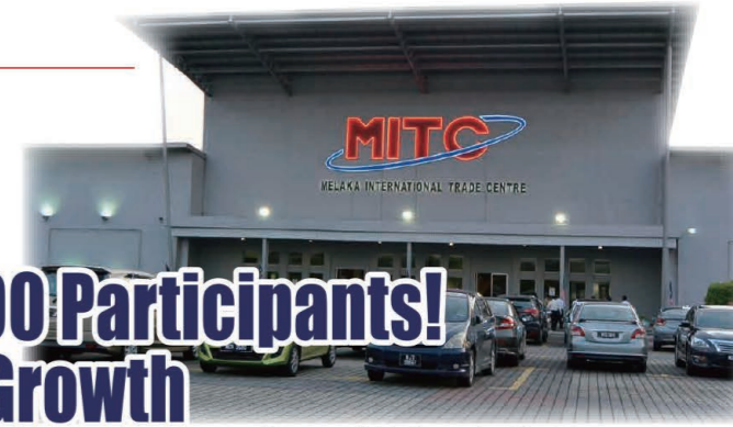
The venue, Melaka International Trade Centre. 会場のマラッカ国際貿易センター